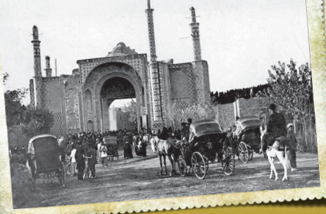
در زمستان نرخ این درشکه‌ها به قرار زیر بود: برای مسافرتی که فراتر از محدوده شهر نبود یک قران و پنج شاهی؛ برای یک ساعت دو قران و ده شاهی در محدوده شهر و با سه قران در خارج از محدوده شهر و نرخ سفر به شمشیر چهار قران بود.