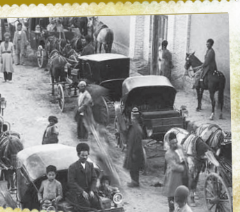
اولین شبکه درشکه‌رانی، با ورود ۳۰ درشکه از فرنگ به تهران کارش را در یک جشن خیابانی رسماً آغاز کرد