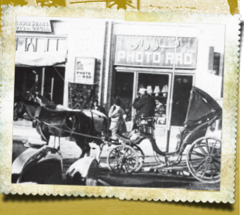
استفاده و رواج درشکه در تهران به اندازه‌ای بود که ۳۰ درشکه زمان ناصر، چند سال بعد در ۱۳۰۱ به حدود ۴۰۰ درشکه در تهران رسید که تعدادی از آنها دیگر خراب شده بودند اما هنوز حدود ۲۹۶ دستگاه درشکه در تهران آن روزگار رفت و آمد می‌کرد.

خودروها به‌عنوان تاکسی استفاده می‌شدند. در تهران تا قبل از آن تنها وسیله‌ای که اهالی تهران در کنار درشکه‌ها با آنها رفت‌وآمد می‌کردند، گاهی اتوبوس‌های شهری و تعداد کمی از اتومبیل‌های کرایه بود. شروع کار تاکسی‌ها در تهران با رقابت شدیدی از طرف درشکه‌داران تهران مواجه شد و این رقابت کم‌کم به اعتراض و ناراحتی صاحبان درشکه‌ها منجر شد. تنزل زیادی که در آمد درشکه‌چی‌ها به‌وجود آمد، بزرگ‌ترین دلیل آنها برای اعتراض و درخواست جمع‌آوری تاکسی‌ها