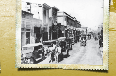
درشکه‌های تک اسبه در محله‌های عمومی از نامداد تا ۳ ساعت پس از شامگاه می‌ایستادند. آنها بی‌کیه برای زمان‌های پس از ساعات مقرر درشکه لازم داشتند می‌توانستند از دواپر شرکت درشکه‌رانی در خیابان امیر به درشکه مخصوصی کرایه کنند.