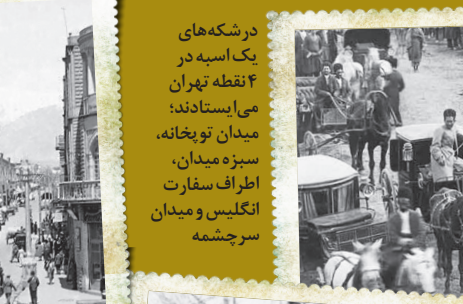
درشکه‌های تک اسبه در ۴ نقطه تهران می‌ایستادند: میدان توپخانه، سبزه میدان، اطراف سفارت انگلیس و میدان سرچشمه