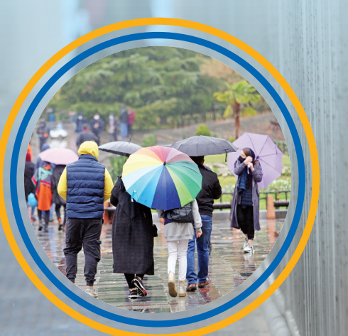
بعضی ها، هدفشان از بیرون آمدن، فقط لذت بردن از قدم زدن زیر باران بود؛ چترها را برداشته بودند و در پارک قدم می زدند و از هوا لذت می بردند.