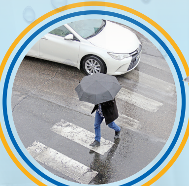
شتابان زیر باران؛ زندگی با وجود باران ادامه داشت هر چند کمکی لطیف تر و شلوغی تر.

فاطمه عباسی پاییز به نیمه رسیده و حالا بعد از کلی انتظار بالاخره باران، پایتخت را هم تر و تازه کرد. بارندگی در تهران هم فال است و هم تماشا. هوای این شهر شلوغ، همیشه خدا محتاج پدیده ای است تا آلودگی هوا را بشوید یا براند. هر قطره ای که از آسمان بر خاک تهران می بارد، نفسی را جاق و هر بادی که در این شهر می وزد، تنی را قیصر می کند. تهران در پاییز از همیشه زیبا تر است و در روزهای بارانی، این زیبایی دوچندان می شود. لازم نیست برای تجربه هوای پاک و بارانی راهی شمال شوید، گشت و گذار در تهران در یک روز بارانی، می تواند یکی از خاطره انگیزترین روزهای شما در این شهر را رقم بزند. از