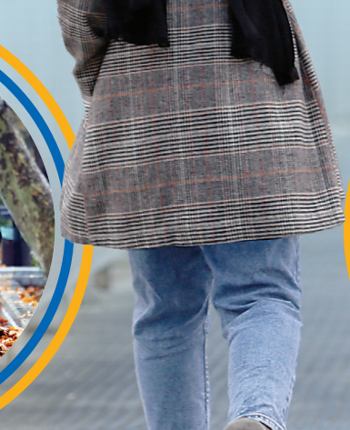
بعضی ها، هدفشان از بیرون آمدن، فقط لذت بردن از قدم زدن زیر باران بود؛ چترها را برداشته بودند و در پارک قدم می زدند و از هوا لذت می بردند.