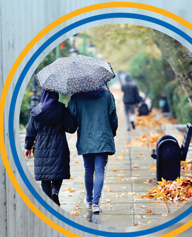
یک چتر برای دو نفر؛ قدم زدن دونفره زیر باران، خاطره ای است که چه بسا هرگز از یاد نرود.