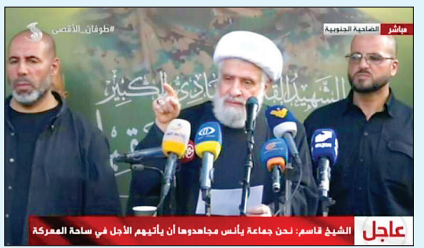
عاجل: الشیخ قاسم، نحن جماعة یائس مجاهدون اما یائهم الأجل فی ساحة المعركة