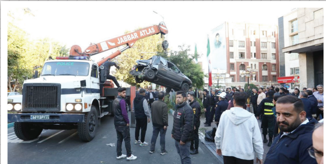
کارشناسان در محل حادثه