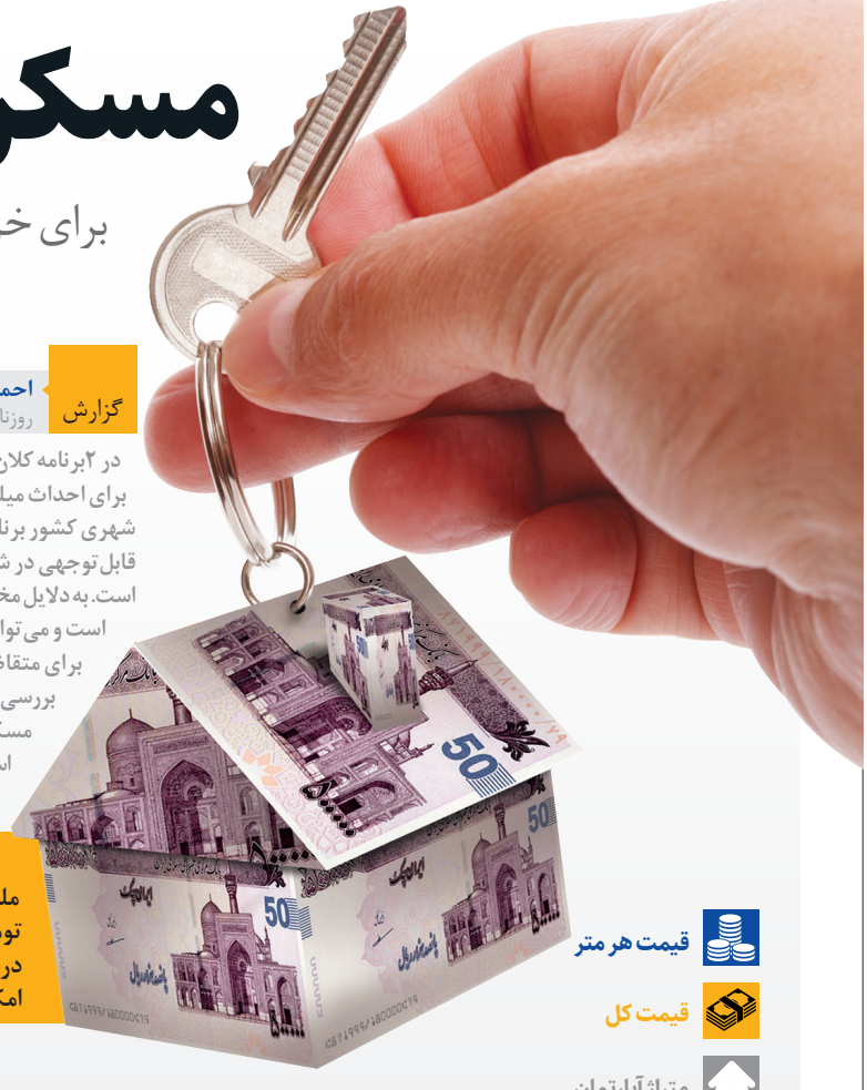
قیمت هر متر قیمت کل متراژ آپارتمان

در مناطق مختلف حومه تهران که محل ساخت پروژه‌های مسکن مهر و نهضت ملی است، می‌توان آپارتمان‌های متوسط متراژ را با قیمت‌های نزدیک به یک میلیارد تومان خریداری کرد. در این گزارش، اطلاعاتی از واحدهای آماده فروش مسکن دولتی در اقصی نقاط این مناطق جمع‌آوری شده که برخی به‌خاطر قیمت محله و کیفیت امکانات، قیمت بالاتری دارند.