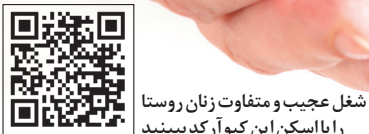
شغل عجیب و متفاوت زنان روستا را با اسکن این کیو آر کد ببینید