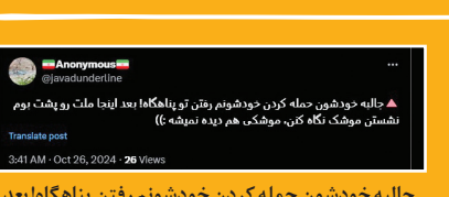
جالبه خودشون حمله کردن خودشونم رفتن پناهگاه‌ها بعد اینجاست روت و پشت بوم نشستن موشک نگاه کنن، موشکی هم دیده نمی‌شه