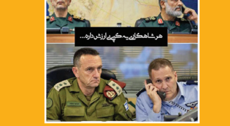
هر شاکهاری به کی بی ارزش داره!