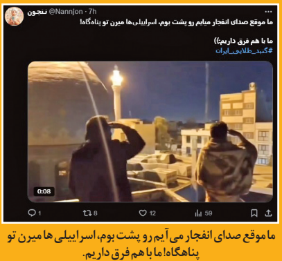
ما موقع صدای انفجار می‌آیم رو پشت بوم، اسرائیلی‌ها میرن تو پناهگاه‌ها ما با هم فرق داریم.

کاربران در فضای مجازی با دست به دست کردن این عکس، به فداکاری و رشادت نیروی پدافند ارتش ایران و سربازان ادای احترام کردند.