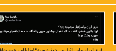
فرق ایران و اسرائیل می‌دونید چیه؟ اون‌ها با اون همه پدافند صدای انفجار می‌شنون میرن پناهگاه‌ها، ما صدای انفجار می‌شنونیم می‌ریم پشت بوم