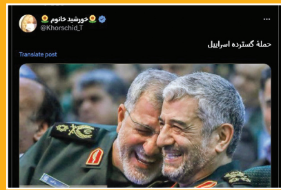
حمله گسترده اسرائیل!