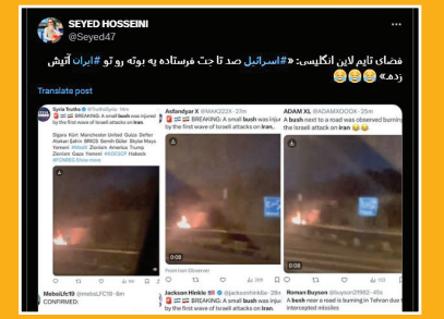
فضای تایم لاین انگلیسی: «اسرائیل صد تا جت فرستاده به بوته رو تو ایران آتیش زده.»