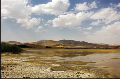
سد بخش آباد افغانستان