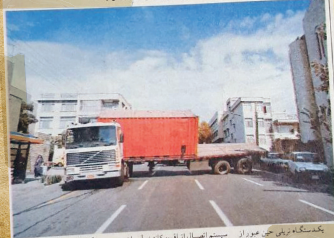
بکدستگاه تریلی حین عبور از سیستم اتصال اتاق به کانتینر آن، از مسیر خود منحرف شد و با