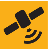
حرکت کلیپر به سمت اروپا

موشک «فالکون هوی» اسپیس ایکس، کاوشگر «اروپا کلیپر» را به سمت قمر «اروپا» متعلق به سیاره مشتری تراب کورد. کلیپر نخستین فضاپیماي ناساست که به مطالعه دنیای اقیانوسی فراتر از زمین اختصاص یافته است. «اروپا» به عقیده دانشمندان مکانی امیدوارکننده برای یافتن حیات فرازمینی به حساب می‌آید.