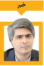
خبر خدمت سرمایه‌گذاری

ماهواره بریتانیایی توانستند کنترل یک ماهواره نظامی متعلق به ایالات متحده را به‌دست بگیرند. این هکرها ادعا کردند که توانستند تمام داده‌های ماهواره را تغییر دهند و آن را از دسترس دولت ایالات متحده خارج کنند. مقامات آمریکا این ادعا را به‌طور رسمی تأیید نکردند، اما اگر درست باشد، یکی از نخستین موارد نفوذ موفق به سیستم‌های ماهواره‌ای نظامی بود. این هک در سال ۱۹۹۹ صورت گرفت.