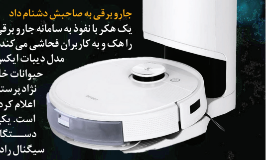
جارو برقی به صاحبش دشنام داد

موشک «فالکون هوی» اسپیس ایکس، کاوشگر «اروپا کلیپر» را به سمت قمر «اروپا» متعلق به سیاره مشتری تراب کورد. کلیپر نخستین فضاپیماي ناساست که به مطالعه دنیای اقیانوسی فراتر از زمین اختصاص یافته است. «اروپا» به عقیده دانشمندان مکانی امیدوارکننده برای یافتن حیات فرازمینی به حساب می‌آید.