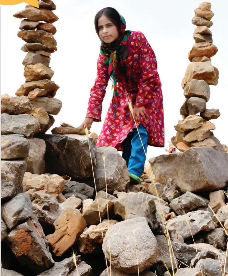
پدر و مادرهای دره سیب

جشنواره فیلم کودک در طول ۳۶ دوره برگزاری اش نتوانسته به هویتی مستقل برسد که پاسخی قانع‌کننده برای این پرسش‌ها داشته باشد.