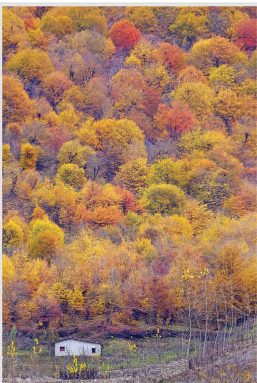
جنگل الیمستان

در مسیر دسترسی به جنگل الیمستان، روستای کوچک و دلنشین لهاش قرار دارد. این روستا با هوای معتدل و کوهستانی خود، ایستگاهی برای استراحت گردشگران