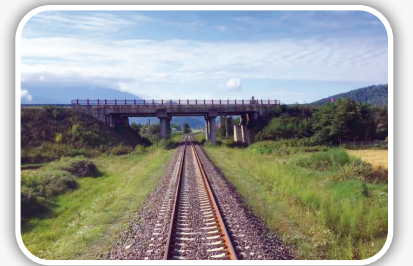
مسیر تهران - گرگان قطار گرگان - تهران در طول حرکتش از ۹۵ تونل و ۱۵۰۰ پل تاریخی عبور می‌کند.