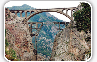
مسیر تهران - ساری یکی از دیدنی‌های مسیر تهران به ساری که باعث شهرت این مسیر شده، پل و روسک است.

امروز، روزی مهم در صنعت می‌رود. سال‌ها پیش در ۲۳ مهرماه ۱۳۰۶، کلنگ ساختمان راه‌آهن سراسری را در تهران و در محل فعلی ایستگاه راه‌آهن تهران بر زمین زدند و عملیات احداث راه‌آهن سراسری ایران رسماً آغاز شد. احداث نخستین خطوط ریلی تبدیل به نقطه عطفی در تاریخ ایران شد و سفر به نقاط مختلف را برای بسیاری از افراد ممکن کرد. ایجاد راه‌آهن در ایران، برای چندین سال، یکی از آرزوهای ملی و بزرگ بود و با وجود حدود نیم قرن تلاش و کوشش از طرف مسئولان وقت، تحقق این آرزو تا سال ۱۳۰۶ به طول انجامید. پس از تکمیل راه‌آهن سراسری ایران، خطوط انشعابی راه‌آهن تازنجان، کاشان و سمنان به سمت تهران نیز گسترش یافتند. خط ریلی اولیه در مسیر جنوب به شمال از دشت خوزستان می‌گذشت و به اهواز می‌رسید و سپس با عبور از کارون و اندیشک تا آراک، قم و تهران امتداد داشت. در ادامه مسیر، این خط ریلی با عبور از فیروزکوه به دریای خزر متصل می‌شد. جالب است بدانید که عمر خط ریلی گسترده امروزی که از آن با نام راه‌آهن سراسری شمال جنوب ایران یاد می‌کنند، نزدیک به یک قرن است و پل و روسک شاخص‌ترین اثر سازه‌ای آن محسوب می‌شود. در مردادماه سال ۱۴۰۰ شمسی نیز، نام راه‌آهن سراسری ایران را با عنوان آخرین اثر ملی ایران در فهرست یونسکو ثبت کردند. به همین مناسبت بد نیست با چند مسیر زیبای ریلی در ایران آشنا شوید.