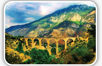
مسیر مشهد - ساری مسیر ریلی قطار مشهد به ساری هم از جنگل‌های بکر شمال ایران می‌گذرد و به همین دلیل شاهد مسیر ریلی فوق‌العاده زیبایی در آن هستیم.