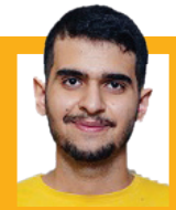
علی‌اکبر قنادری، رئیس‌جمهور

بودجه آموزش عالی کشور کمتر از ۳۳ درصد بودجه کل کشور و حتی پایین تر از بودجه یک دانشگاه برتر دنیا است. در مقایسه با قیمت ارز، آموزش عالی کشور امروز کمتر از ۵۰ درصد بودجه سال ۹۰ را در اختیار دارد. دانشگاه‌ها به مسئولیت‌های اجتماعی، اقتصادی و فرهنگی خود واقفند؛ بنابراین لازم است حمایت‌های مالی از این مراکز صورت بگیرد.