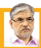
حسین سیمایی، وزیر علوم

اگر به جوانان و استادان خود توجه کنیم، جوانان ما برای ماندن تشویق می‌شوند. باید هوای آنها بی‌راستی که در مملکت مانده و برای کشور زحمت می‌کشند را داشته باشیم. پیگیری خواهیم کرد هوای استادان و نخبگان را داشته باشیم. اگر این اقدام را انجام دهیم، همه می‌فهمند که به علم و فرهنگ احترام می‌گذاریم و آنها بی‌کی می‌خواهند بروند، نیز خواهند ماند.