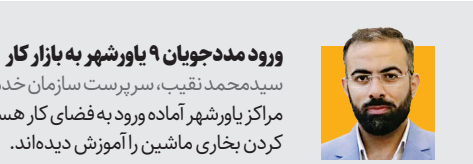
رودمدحجوان ۹ یاورشهر به بازار کار

منطقه ۱۱ طرح سنجش سلامت درختان کهنسال خیابان ولی‌عصر آغاز و مرحله اول با محلول‌پاشی درختان انجام شد.