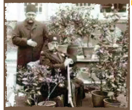
مظفرالدین شاه در کاخ گلستان

تهران علاوه بر اینکه اقوام مختلف را در خود جای داده، محل سکونت پیروان ادیان مختلف چون ارامنه، زرتشتیان و کلیسیاها هم بوده است، جمعیتی که تأثیر و نقش بسزایی در توسعه و نوآوری پایتخت داشتند.