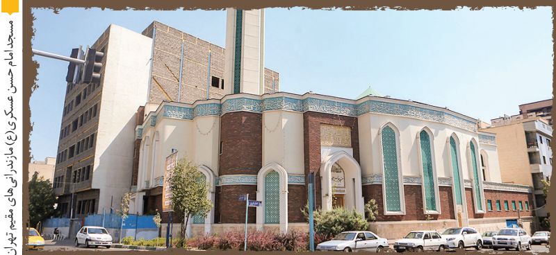
مسجد امام حسن عسکری (ع) مازندرانی‌های مقیم تهران