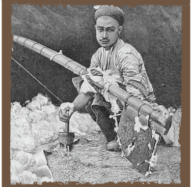
مرد حلاج در دوره قاجار