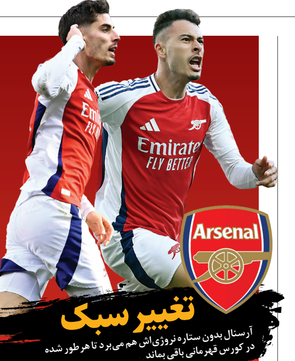
آرسنال بدون ستاره نروژی‌اش هم می‌برد تا هر طور شده در کورس قهرمانی باقی بماند

هر دو گل رئالی‌ها در این بازی از پشت محوطه جریمه زده شد. رئال مادرید از ۱۱ نوامبر ۲۰۲۳ مقابل والنسیا که کارواخال و وینیسوس هر دو از بیرون محوطه جریمه گل زده بودند، چنین چیزی را تجربه نکرده بود. در این مدت رئال در ۳۹ بازی قبل لالیگایی فقط ۳ گل با شوت از بیرون محوطه جریمه زده بود؛ شومانی مقابل مایورکا در آوریل و قدریکو و لورده در مقابل همین تیم در ماه آگوست با صریح کاشته.