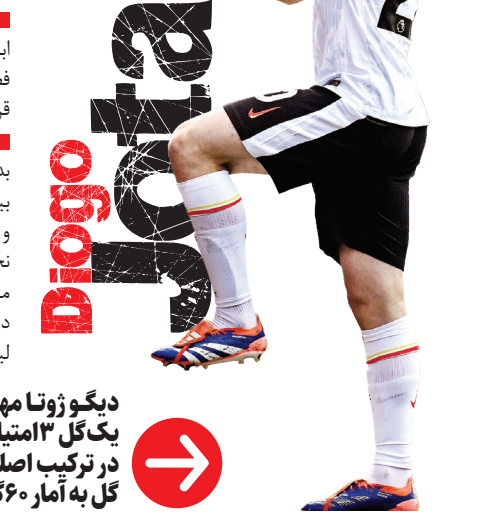
دیگو ژوتا مهاجم محبوب اشلوت است. او یک گل ۱۳ امتیازی دیگر در صدمین بازی‌اش که در ترکیب اصلی لیورپول قرار داشت زد و با این گل به آمار ۶۰ گل با پیراهن این تیم رسید.