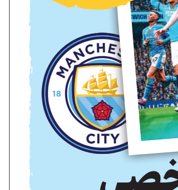
سیتی در این فصل خوب گل می‌خورد؛ آن هم با این همه مدافع گران قیمت. منچستر سیتی در این فصل در ۴ بازی عقب افتاده اما در نهایت شکست نخورده است.

در این فصل خوب گل می‌خورد؛ آن هم با این همه مدافع گران قیمت. منچستر سیتی در این فصل در ۴ بازی عقب افتاده اما در نهایت شکست نخورده است. در این فصل مقابل لیگ دروازه این تیم بسته مانده. آخرین باری که منچستر سیتی تا هفته هفتم لیگ برتر کمتر از ۲ گلن شیت داشت، به سال ۲۰۱۶ بازی کرد.