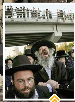
یهودیان ارتدکس به خاطر اعزام به سربازی تحصن کرده و به شدت اعتراض می کنند. ۲۷ ژوئن ۲۰۲۳

فلسطینی ها در روز هفتم اکتبر ۲۰۲۳، با عبور از دیوار در خان یونس در جنوب غزه، کنترل یک تانک رادر اختیار گرفته اند.