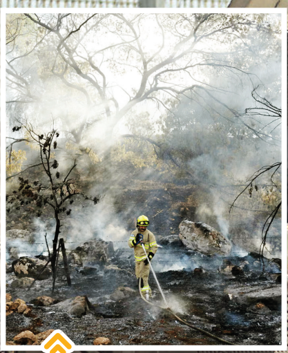
آتش نشان ها در پی حمله راکتی از لبنان آتش را مهار می کنند: ۴ جولای ۲۰۲۴