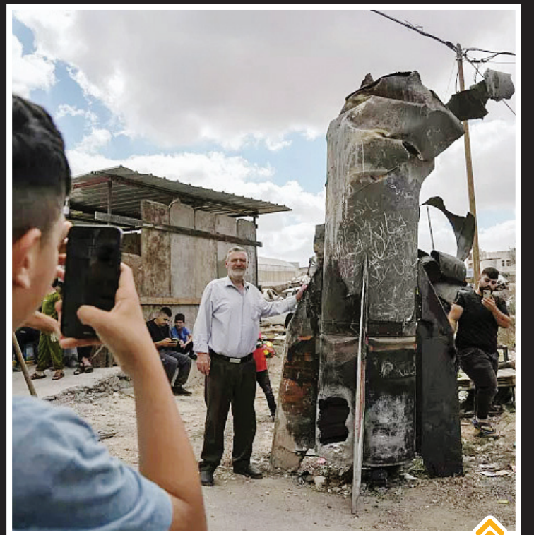
فلسطینی ها با بقایای یک موشک ایرانی در حملات موشکی اخیر عکس یادگاری می گیرند. / اکتبر ۲۰۲۴