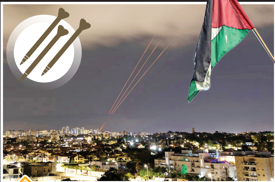
موشک باران اشکلون با موشک های ایرانی: ۱۴ آوریل ۲۰۲۳