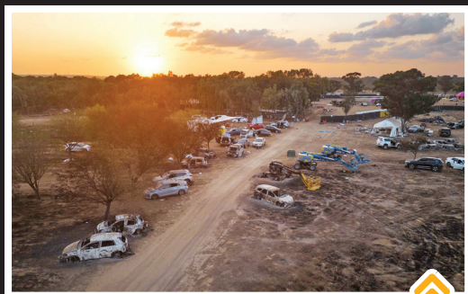
یکی از شهرک های رژیم صهیونیستی بعد از حمله غافلگیرانه حماس: ۱۱ اکتبر ۲۰۲۳