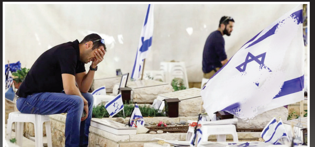
گورستان نظامیان صهیونیستی کشته شده در نبرد با حماس: نوامبر ۲۰۲۳