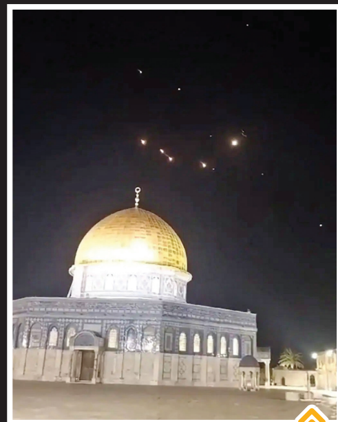
عبور موشک های ایرانی از آسمان بیت المقدس؛ دیده شدن موشک های ایران در آسمان، یکی از شادترین لحظات مردم فلسطین را در یک سال اخیر رقم زد. ۱۴ آوریل ۲۰۲۴

درست یک سال پیش، آفتاب بر خاورمیانه ای امید که دیگر هرگز مثل سابق نبود؛ رزمندگان حماس از زمین و دریا و آسمان، چنان بر رژیم صهیونیستی یورش بردند که تاریخ را می شنود به پیش و پس از آن تقسیم کرد. تلفات عظیمی بر رژیم غاصب وارد شد و همچنان ده ها گروگان آنها در اختیار حماس است. ارتش صهیونیستی در سبانه ترین حملاتی که در سال های اخیر دنیا شاهدش بوده، غزه را زیر آتش برد، در ادامه تجاوزات خود را گسترده تر کرد و لبنان و حتی منافع ایران را هم هدف قرار داد. اما همچنان بعد از یک سال، شوک و غافلگیری آن حمله حماس، در سرزمین های اشغالی و خاورمیانه و فراتر از آن هم احساس می شود و تمام آن وحشی گری های ارتش این رژیم هم نتوانسته بهت و استیصال این رژیم را کاهش دهد. رژیم صهیونیستی در این یک سال، بارها مردم بی گناه و غیر نظامیان بی دفاع را قربانی خشونت و ظلم بی حد و اندازه خود کرده و علاوه بر مردم غزه و دیگر نقاط فلسطین، در ماه های اخیر بیروت را هم به خاک و خون کشیده است. این تجاوزات و حمله به منافع جمهوری اسلامی ایران البته با واکنش مقتدرانه ایران همراه بود و ۲ موج حمله موشکی تلافی جویانه ایران، نه فقط اعتبار صهیونیست ها را زیر سوال برد که موجی از شادی را در فلسطین و دیگر کشورهای اسلامی به راه انداخت.