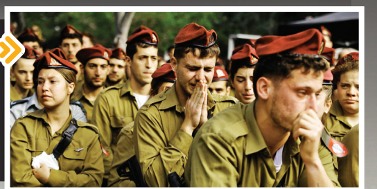
سربازان اسرائیلی در مراسم تشییع یکی از اعضای ارتش گریه می کنند: ۷ مارس ۲۰۲۳