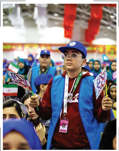
افتتاحیه سی و ششمین جشنواره بین‌المللی فیلم‌های کودکان و نوجوانان افتتاحیه جشنواره بین‌المللی فیلم‌های کودکان و نوجوانان، ویژه داوران و خبرنگاران کودک و نوجوان، صبح جمعه ۱۳ مهر ۱۴۰۳ در سالن گلستان شهدای اصفهان برگزار شد.