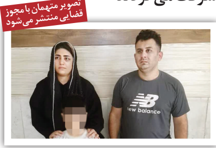
تصویر بر متهمان با مجوز قضایی منتشر می‌شود

زوج جوان که با همراه داشتن فرزند خردسال خود دست به سرقت طلاهای زنان مسافر می‌زدند دستگیر شدند. به گزارش همشهری، از چندی پیش مأموران پلیس آگاهی استان البرز در جریان زورگیری‌های عجیب یک زوج قرار گرفتند. بررسی‌ها نشان می‌داد که زن و مرد جوانی در حالی که پسر خردسال خود را نیز همراه داشتند، سوار بر یک خودروی سمند در خیابان‌های کرج تردد کرده و اقدام به سوار کردن زنانی می‌کردند که منتظر تاکسی بودند. براساس اظهارات شاکیان، مرد جوان نقش راننده را بازی می‌کرد و همسر و کودکش نیز انمود می‌کردند که مسافر هستند تا کسی به آنها مشکوک نشود. اما وقتی طعمه‌شان سوار ماشین می‌شد، پس از طی مسیری کوتاه، راننده وارد یک خیابان خلوت شده و با همدستی همسرش اقدام به تهدید مسافرشان می‌کردند. آنها سپس به زور طلاهای طعمه‌شان را بریده و سرقت می‌کردند و پس از پیاده کردن او در خیابان، متواری می‌شدند. با این اطلاعات، تحقیقات کارآگاهان پلیس آگاهی برای شناسایی و دستگیری اعضای این باند خانوادگی شروع شد. مأموران با حضور در محل‌های سرقت و بررسی ساختمان‌ها دست‌آورده و اعضای این باند را که یک زوج جوان و فرزند خردسال‌شان بودند شناسایی کنند. به گفته سرهنگ حکمت‌الله شجاعی، رئیس پلیس آگاهی استان البرز، اعضای این باند در یک عملیات ضربتی دستگیر شدند و به ۱۳ فقره اخذی اعتراف کردند. قاضی پرونده با صدور مجوز انتشار عکس بدون پوشش آنها در رسانه‌ها از شاکیان احتمالی خواسته است برای شکایت از زوج سارق به پلیس آگاهی استان البرز واقع در میدان طالقانی کرج مراجعه کنند.