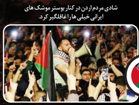
شادی مردم اردن در کنار بوستر موشک‌های ایرانی خیلی‌ها را غافلگیر کرد.