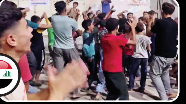
پایکوبی در شهرهای مختلف عراق، دست‌کمی از شادی مردم ایران نداشت.