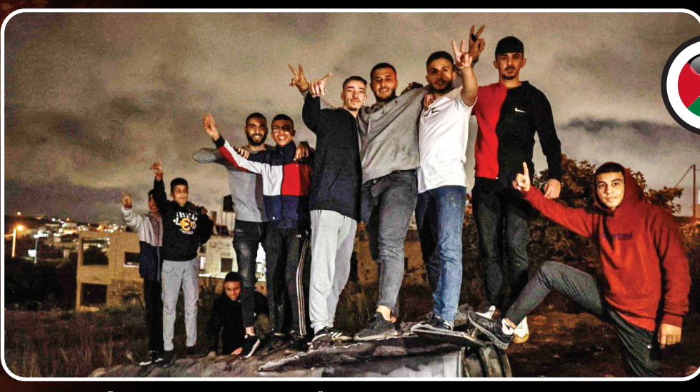
رام‌الله در فلسطین صحنه شادی جوانان فلسطینی بود، به خصوص آنکه بوستر موشک هم نصیب جشن آنها شده بود.

هیچ کس به اندازه مردم غزه از این حمله انتقامی خوشحال نشده است. نزدیک به یک سال است که زیر آتش و ظلم ارتش رژیم صهیونیستی به سر می‌برند و از جمله بهترین دلخوشی شان در این مدت، آبار حمله موشکی ایران به سرزمین‌های اشغالی بوده است. دیشب تصاویر زیادی از شادی مردم در غزه منتشر شد.