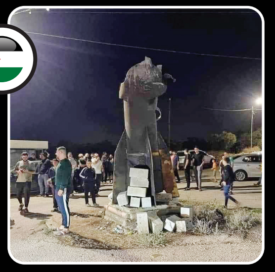
جنین: جوانان فلسطینی، بوستر موشک‌های ایرانی را در میدان‌ها جمع کردند و دوش به شادی برداختند.