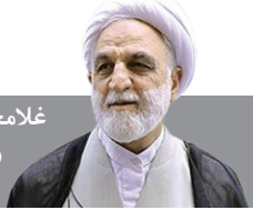
غلامحسین محسنی اژه‌ای رئیس قوه قضاییه