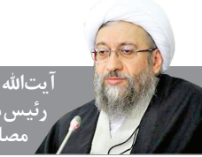
آیت‌الله صادق آملی‌لاریجانی رئیس مجمع تشخیص مصلحت نظام

«إِنَّ تَنْصُرُوا اللَّهَ يَنْصُرْكُمْ وَيُخَيِّتْ أَقْدَامَكُمْ» وعده صادق خداوند متعال و بشراتی به تمامی ملت‌های مسلمان و مستضعف جهان است که نصرت الهی امری حتمی است و به اذن پروردگار بسزودی زمین از لوث وجود صهیونیست‌های انسان‌نما و تبهکار پاک خواهد شد و اضمحلال و ازاله رژیم صهیونیستی محقق خواهد شد. اینجانب ضمن تقدیر از عملیات افتخار آمیز سپاه پاسداران انقلاب اسلامی به همراهی نیروهای مسلح جمهوری اسلامی ایران، این ظفر را به محضر حضرت ولی عصر (عج)، فرماندهی معظم کل قوا، دلاور مردان نیروهای مسلح، مردم شریف و غیر تمدن ایران اسلامی و ممالک محور مقاومت و تمامی آزادگانی که دل در گروی مقاومت و ایستادگی دارند، تبریک و تهنیت می‌گویم.