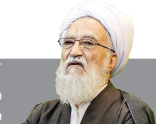
آیت‌الله موحیدی کرمانی رئیس مجلس خبرگان رهبری

دشمن صهیونیستی این را می‌داند و امیدواریم پند کافی را گرفته باشد. نکته مهم این است که ایران با عمل خودش نشان داد که پشتوانه مهمی برای محور مقاومت در همه جا هست و نشان‌آه‌الله این مسئله تحت هدایت و نظر مقام معظم رهبری ادامه پیدا می‌کند.