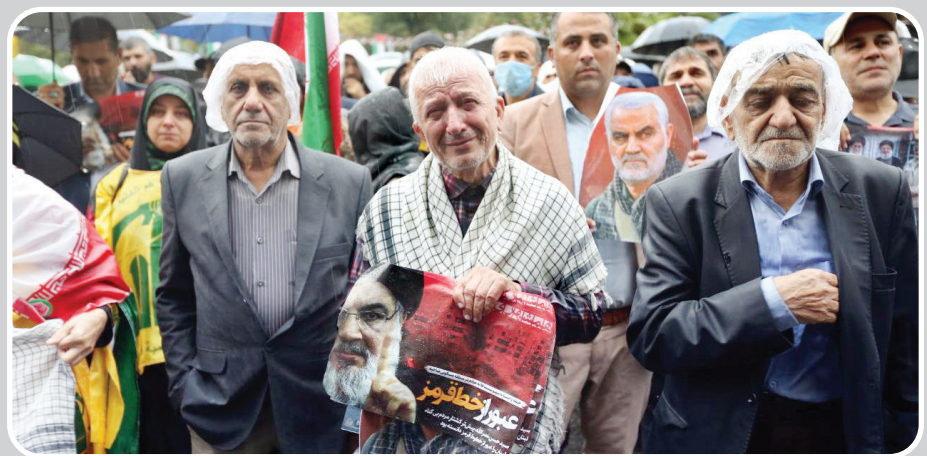
سید مقاومت، پادشاه جهاد در راه خدا را دریافت کرد.