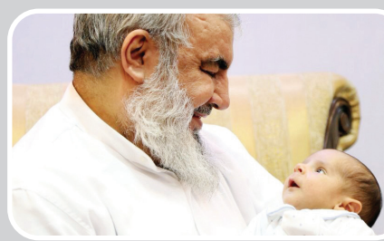
سید حسن نصرالله در کنار نوه اش