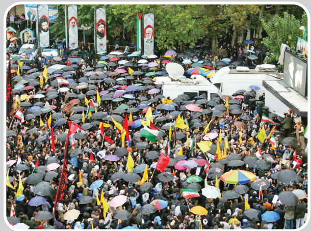
ایران یک صدای فریاد می‌زند که ضربات جبهه مقاومت، کوبنده‌تر خواهد بود.