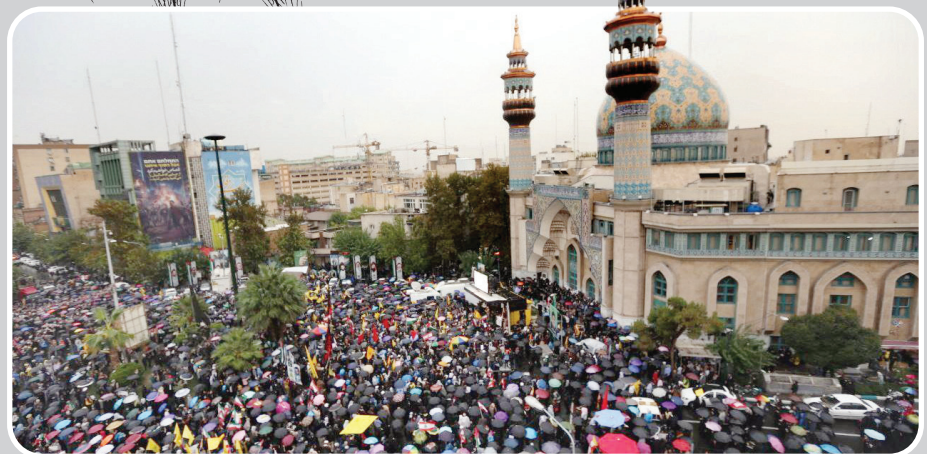
تجمع مردم تهران در میدان فلسطین، نمادی از مقاومت جهانی در برابر ظلم است.

ایران و لبنان ندارد؛ هر جاحف از مقاومت جبهه اسلام باشد مرزها بی‌معنا می‌شوند. جمعه‌شب که رژیم صهیونیستی لبنان را زیر آتش بمباران قرار داده بود، مردم ایران هم تا صبح چشم روی هم نگذاشتند. شمار آنهایی که جمعه شب در میدان فلسطین جمع شدند تا برای آن هدف بزرگ یعنی نابودی اسرائیل عهد و پیمان تازه کنند، کم نبود. با این حال روز گذشته نیز پس از اعلام خبر شهادت سید حسن نصرالله، تجمع مردمی در پاسخ به جنایات صهیونیست‌ها در حمله به مردم لبنان و بمباران مردم انقلابی و شهید پرور پایتخت در میدان فلسطین برگزار شد و پایتخت نشینان، حمله این رژیم منحوس به مناطق مسکونی در ضاحیه جنوبی بیروت را به شدت محکوم کردند. مردم تهران در این گردهمایی در هوای بارانی یکصد شعار «لبنیک یا حسین»، «انتقام انتقام»، «ای رهبر آزاده آماده‌ایم آماده»، «خونی که در رگ ماست هدیه به رهبر ماست»، «الله اکبر خامنه‌ای رهبر»، «ای پسر فاطمه تسلیت تسلیت» سر دادند. علاوه بر آن شرکت کنندگان در این تجمع مردمی، پلاکاردهایی در دست داشتند که روی آن عکس شهید سید حسن نصرالله نقش بسته بود. مردم تهران پس از عزاداری برای شهید سید حسن نصرالله شعار «هر سر باز حزب الله پرچمدار نصرالله»، «چلو کشیده صهیون عقبیت نخواهم نشست»، «نصرالله نصرالله راحت ادامه دارد» را یکصدبار فریاد زدند.