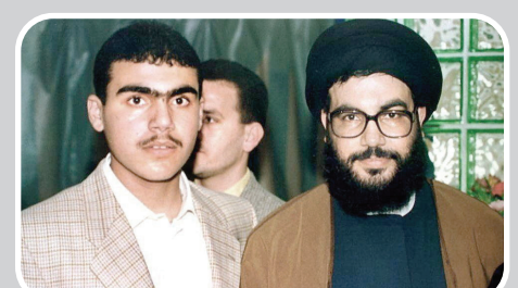
سید حسن نصرالله در کنار فرزندش هادی