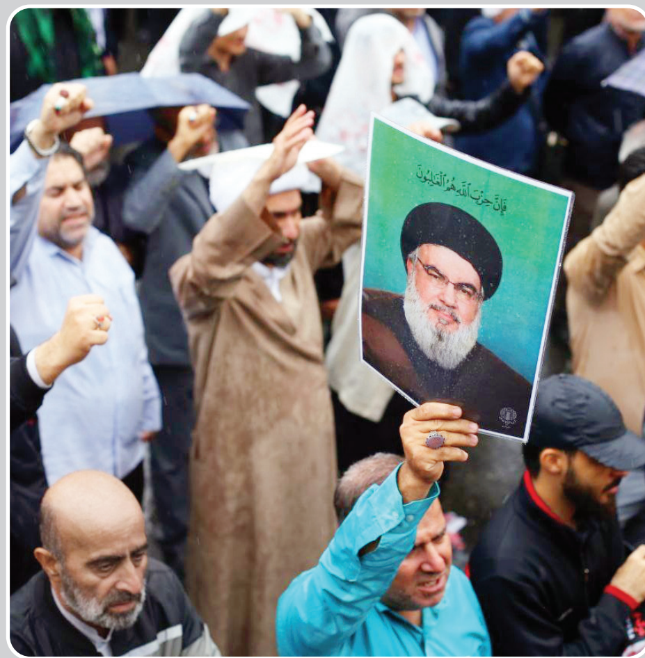
راه سید حسن و مکتب او تا ابد ادامه خواهد داشت.