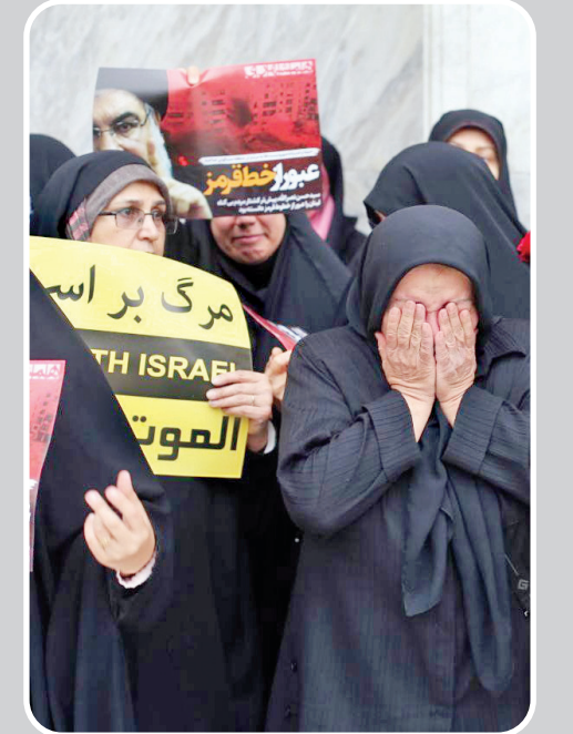
به برکت خون سید مقاومت، اسرائیل نابود خواهد شد.