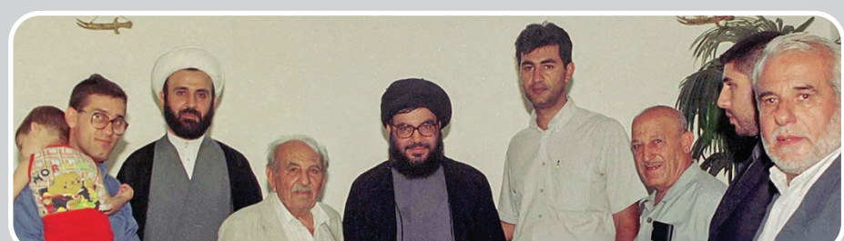
سید حسن نصرالله در کنار شیخ نبیل قاووق، مسئول منطقه جنوبی حزب الله در روزهای اشغال لبنان

سید حسن نصرالله درباره آخرین مأموریت جهادی هادی (پسرش) چنین گفت: با او وداع کردم، وی را در آغوش گرفتم و بوسیدم.