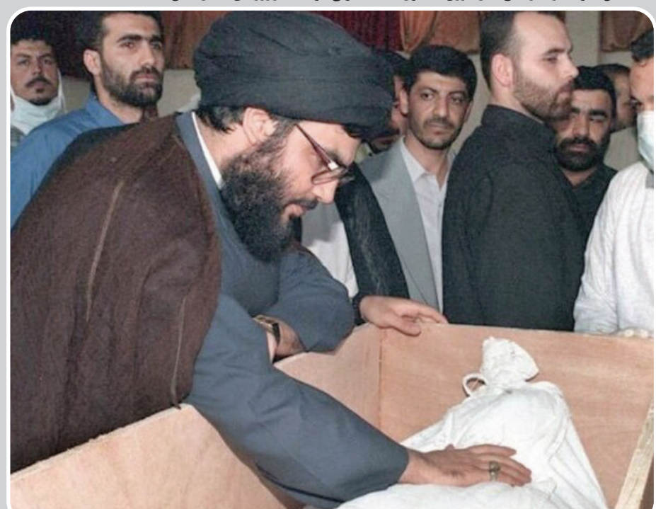
سید حسن نصرالله در حال وداع با پیکر فرزند شهیدش هادی