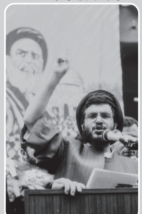
دهه ۶۰ تهران، سخنرانی سید حسن نصرالله در روز قدس