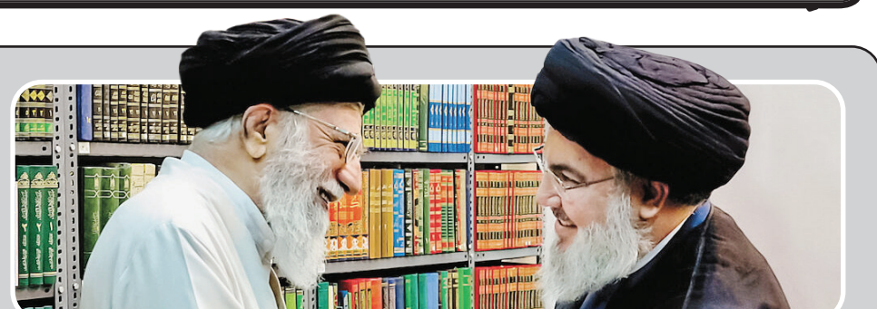
دیدار سید حسن نصرالله با رهبر معظم انقلاب