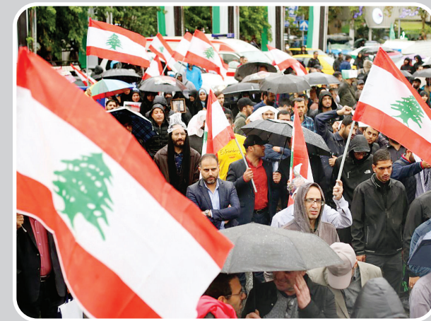
ایرانیان، پرچم لبنان را برافراشتند تا جهان بداند مقاومت ادامه دارد.