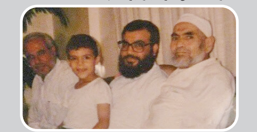
قایم از سید حسن نصرالله در خانه پدری