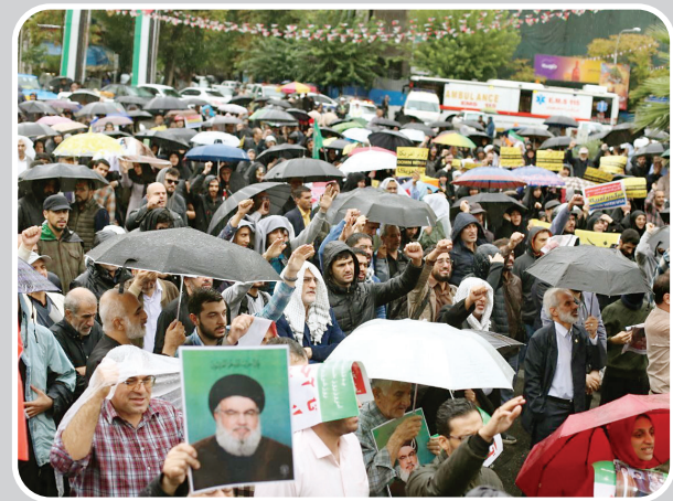
حتی دیروز هوای تهران هم گریست تا درخت مقاومت، بیش از گذشته آبیاری شود.