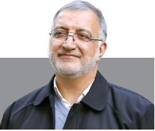
علیر فزاکانی: آینده جهان از آن حزب الله است

نخست وزیر قاتل رژیم جعلی و کودک کش در حالی که در سازمان ملل به صندلی‌های خالی اجلاس لبخند می‌زد، نقشه شهادت سرو رعنا مقاومت را نهایی و سگ‌های هار خود را به سوی بیروت قهرمان راهی کرد و در هجوم سیاه و ناجوانمردانه بمب‌های آمریکایی، خطای تاریخی بزرگ خود را رقم زد تا حیات جاودانی دبیر کل نستوه حزب الله لبنان را رقم زند. شهادت اسوه مقاومت، مجاهد فرزانه و رزمنده دلاور، آیت‌الله شهید، سید حسن نصرالله را به محضر امام عصر حضرت بقیه‌الله الاعظم (عج)، ولی امر مسلمین جهان حضرت آیت‌الله العظمی خامنه‌ای، حزب‌الله سرافراز، رزمندگان محور مقاومت، امت اسلامی و همه آزادگان جهان تبریک و تسلیت عرض می‌کنم. بی تردید بر اساس وعده قطعی و صادق الهی، آینده جهان از آن حزب‌الله است و نجات و فلاح ملل اسلامی در مقاومت و ادامه راه شهیدانی است که دفع فتنه و رفع خطر غده سرطانی منطقه را با نثار خون مطهر خویش دنبال کردند. اینک که رهبر عظیم‌الشان انقلاب اسلامی، ایستادگی در کنار ملت مظلوم لبنان و دفاع از آرمان مقدس فلسطین را بر آحاد مسلمین واجب فرمودند، با لبیک به ندای خمینی زمان، رویارویی با رژیم غاصب و ظالم، و خبیث را با دل و جان پذیرا می‌شویم و در طریق قدس تا تنبیه صهیونیست‌های کوردل و ابله و نیز اذتاب شیطان بزرگ با توکل به خداوند متعال و استعانت از ارواح شهدای انتفاضه و طوفان الاقصی گام برمی‌داریم و تا پشیمانی دشمن از پای نخواهیم نشست.