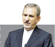
اسحاق جهانگیری: اسرائیل در تلاش برای گسترش درگیری است

شهادت سید حسن نصرالله دبیر کل حزب‌الله لبنان به‌دست رژیم فاسد صهیونیستی، اگرچه این رهبر مجاهد را به آرزوی دیرینه‌اش رساند اما دوستداران و علاقه‌مندان به جبهه مقاومت، مسلمانان و آزادگان جهان را به سوگ نشاند. این شهید بزرگوار بیش از ۳۰ سال از عمر پر برکت خویش را به رهبری جبهه مقاومت اسلامی لبنان و مبارزه با رژیم صهیونیستی گذراند. آرمان فلسطین را خط‌مشی اصلی مقاومت لبنان قرار داد و رنج مردم فلسطین را رنج خود می‌دانست. اخراج اشغالگران صهیونیست از لبنان، پیروزی در جنگ ۳۳ روزه و نیز برافراشته نگاه داشتن پرچم بر افتخار مقاومت در منطقه، از جمله دستاوردهای آن شهید بزرگوار است. اینجانب شهادت سیدمقاومت و جمعی از یارانش را به حضرت عصر (عج)، رهبر معظم انقلاب، جبهه مقاومت و تمامی مسلمانان و آزادی‌خواهان دنیا تبریک و تسلیت عرض می‌کنم. بی تردید به مدد الهی، تربیت‌شدگان مکتب مقاومت، راه این شهید بزرگوار و مسیر پر قدرت حزب‌الله در مقابله با رژیم جنایتکار و کودک‌کش صهیونیستی را ادامه خواهند داد.