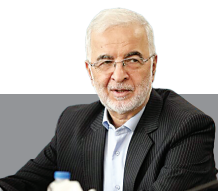
وزیر کشور: شهید نصرالله رنج فلسطین را رنج خود می‌دانست

شهادت جان‌باخته راه حق، سید حسن نصرالله که سال‌ها صادقانه و جان‌پرکف در برابر نسل‌کشی رژیم منحوس صهیونیستی ایستاد و اکنون به جمع یاران شهید برحق پیوسته، ضایع‌ای برای جهان اسلام است. آنچه طی این مدت بر مردم غزه و بیروت رفت نشانی است بر دواعی آنان که دم از دموکراسی و حقوق بشر می‌زنند. اینجانب شهادت مجاهد عالی‌مقام، سید حسن نصرالله و همراهان وفادارش را تسلیت گفته و ضمن محکوم کردن رفتار وحشیانه و توریستی رژیم صهیونیستی اعلام می‌دارم بی شک علم حق خواهی حزب‌الله بر زمین نخواهد ماند که دست خدا بالاترین دست‌هاست.