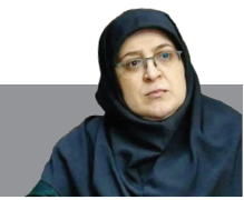
سخنگوی دولت: علم حق خواهی حزب الله بر زمین نخواهد ماند

نخست وزیر قاتل رژیم جعلی و کودک کش در حالی که در سازمان ملل به صندلی‌های خالی اجلاس لبخند می‌زد، نقشه شهادت سرو رعنا مقاومت را نهایی و سگ‌های هار خود را به سوی بیروت قهرمان راهی کرد و در هجوم سیاه و ناجوانمردانه بمب‌های آمریکایی، خطای تاریخی بزرگ خود را رقم زد تا حیات جاودانی دبیر کل نستوه حزب الله لبنان را رقم زند. شهادت اسوه مقاومت، مجاهد فرزانه و رزمنده دلاور، آیت‌الله شهید، سید حسن نصرالله را به محضر امام عصر حضرت بقیه‌الله الاعظم (عج)، ولی امر مسلمین جهان حضرت آیت‌الله العظمی خامنه‌ای، حزب‌الله سرافراز، رزمندگان محور مقاومت، امت اسلامی و همه آزادگان جهان تبریک و تسلیت عرض می‌کنم. بی تردید بر اساس وعده قطعی و صادق الهی، آینده جهان از آن حزب‌الله است و نجات و فلاح ملل اسلامی در مقاومت و ادامه راه شهیدانی است که دفع فتنه و رفع خطر غده سرطانی منطقه را با نثار خون مطهر خویش دنبال کردند. اینک که رهبر عظیم‌الشان انقلاب اسلامی، ایستادگی در کنار ملت مظلوم لبنان و دفاع از آرمان مقدس فلسطین را بر آحاد مسلمین واجب فرمودند، با لبیک به ندای خمینی زمان، رویارویی با رژیم غاصب و ظالم، و خبیث را با دل و جان پذیرا می‌شویم و در طریق قدس تا تنبیه صهیونیست‌های کوردل و ابله و نیز اذتاب شیطان بزرگ با توکل به خداوند متعال و استعانت از ارواح شهدای انتفاضه و طوفان الاقصی گام برمی‌داریم و تا پشیمانی دشمن از پای نخواهیم نشست.