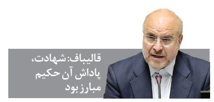
قالیباف: شهادت، پاداش آن حکیم مبارز بود

دبیر کل حزب الله لبنان، فخر مسلمانان و اسوه جهاد و مقاومت، شهید سید حسن نصرالله به آرزوی دیرینه خود، یعنی نایل آمدن به درجه رفیع شهادت، دست یافت. کلمات در وصف رشادت‌ها، سلحشوری‌ها، دلاوری‌ها و مجاهدت‌های مداوم او حقیر و ناچیزند. داغی بزرگ بر دل همه مظلومان و مستضعفان عالم نشسته است. حمله تروریستی شامگاه ۶ مهر ماه صهیونیست‌ها به ضاحیه و فقدان شخصیت‌های برجسته مقاومت و در رأس آنها رهبر جاویدالتر حزب الله، شهید سید حسن نصرالله، شجره طیبه مقاومت را بیش از پیش مستحکم می‌کند و نام «سید حسن نصرالله» تا ابد بر تارک اسلام خواهد درخشید. ما این گونه آموختیم که فرماندهی از آن خداست. مسیر الهی هیچ‌گاه بدون فرمانده خواهد رسید. جامعه جهانی فراموش نخواهد کرد که فرمان این حمله تروریستی از نیویورک صادر شد و آمریکایی‌ها نمی‌توانند خود را از همدستی با صهیونیست‌ها تیره کنند. اینجانب شهادت مجاهد عالی مقام، شهید سید حسن نصرالله را به رهبر معظم انقلاب اسلامی و جمیع مستضعفان و آزادگان جهان تبریک و تسلیت عرض می‌کنم.