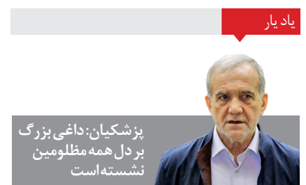
پژشکبان: داغی بزرگ بر دل همه مظلومین نشسته است

آنچه رهبر معظم انقلاب و رهبران مقاومت درباره شهید نصرالله گفتند