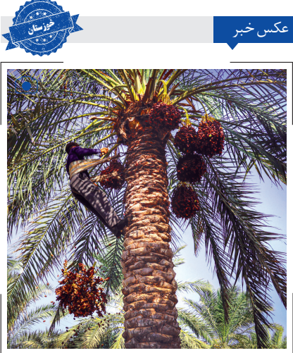
برداشت خرما در خوزستان