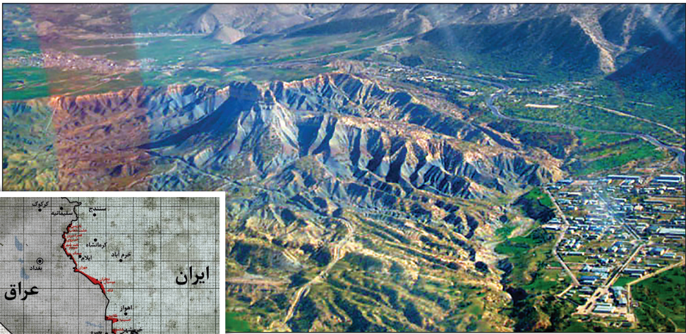
نقش ایل خزل

میمک نخستین منطقه‌ای است که از سوی بعثی‌ها تصرف شد؛ نخستین عملیات دفاع‌مقدس هم برای بازپس‌گیری همین منطقه صورت گرفت