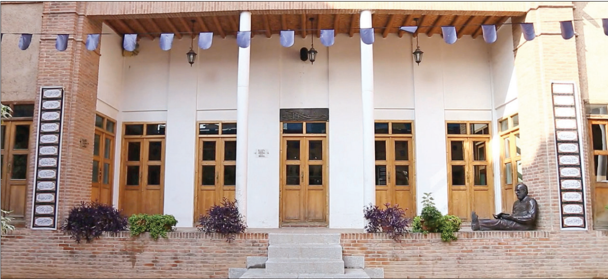
خانه موزه شهید چمران

✓ سعیده مرادی در کنار مکان‌های تاریخی شناخته شده تهران، موزه‌هایی هستند که رنگ و بوی دیگری دارند؛ محل‌هایی که از آنها عطر شهادت و شهامت به مشام می‌رسد. برخی از این خانه‌موزه‌ها متعلق به افرادی بوده‌اند که نام آنها با تاریخ گره خورده است؛ افرادی مانند شهیدان چمران، بهشتی، مدرس، رجایی و باهنر که در سال‌های بعد از پیروزی انقلاب اسلامی و دفاع مقدس مرد میدان بودند، از جان خود گذشتند و نامشان در دفتر شهدای این خاک به ثبت رسید. برخی از خانه‌موزه‌ها هم به شهدایی تعلق دارند که شاید نامشان کمتر شناخته شده باشد، اما با سیری در خانه آنها و بازدید از آثار به جامانده‌شان می‌توان به بزرگی روح و عمق شجاعت‌شان در دوران دفاع مقدس پی برد. برای آشنایی با این خانه‌موزه‌ها با ما همراه باشید.