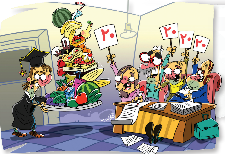
طرح همشهری اسپهبد شیرازی

جلسات دفاع پایان‌نامه دانشجویان در سال‌های اخیر با میزهای پذیرایی متنوع و هدیه‌های گران به استادان همراه شده است