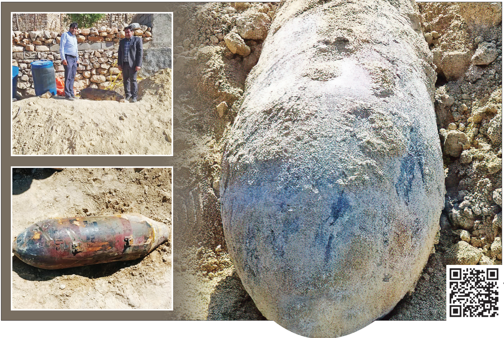
برای دیدن فیلم‌هایی از مستند جنگ گجستان و همچنین کشف بوم خشتی نشده در روزهای اخیر این کیو آر کد را اسکن کنید.