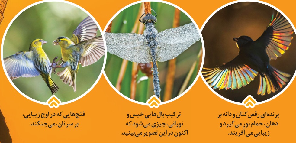
پیترز می‌گوید یک دهه طول کشید تا توانست تکنیک شکار چنین تصویری را خلق کند.

وقتی نورا به منشورها می‌تابند، می‌شکنند و به نورهای با رنگ‌های رویایی تبدیل می‌شوند. این بازی رنگ‌ها توجه «آندرو فوسک پیترز»، عکاس انگلیسی را به خود جلب کرد اما او به‌جای منشور، تابیدن نور به بال‌ها را به چالش کشید؛ تابیدن نور به بال طوطی‌ها، پشه‌ها و سنجاقک‌ها و عبور نور از بال‌های رنگی آنها را با دوربینش به تصویر کشید. البته کار به این سادگی‌ها هم نبود. تنها برای تهیه این ۶ تصویر، او ۱۰ سال زمان گذاشته است. مثلاً پیترز هفته‌ها در باتلاقی دراز کشیده و خوراک پشه‌ها شده تا بتواند از انعکاس نور در بال یک پشه، عکس بگیرد. البته او از این سختی‌ها، غمگین نیست و معتقد است کار او، کاری عاشقانه است و دوست دارد با چالش‌ها مواجه شود و برای عبور از آنها، راه‌حل بیابد. حالا عکس‌های او به مرحله نهایی جایزه معتبر عکس‌های حیات وحش بریتانیا رسیده و پیش‌روی ماست تا از تماشای آنها لذت ببریم.