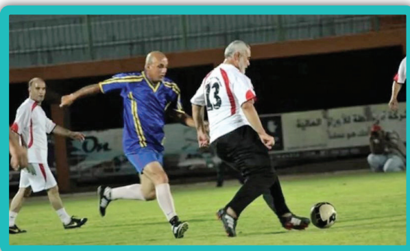
این عکس مربوط به دوره تبعید شهید هنیه توسط رژیم اشغالگر به منطقه مرج الزهور در جنوب لبنان در سال ۱۹۹۲ است.