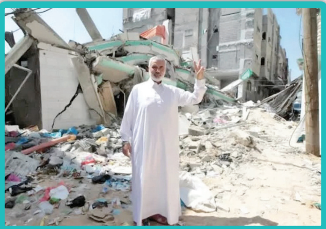
این تصویر مربوط به هدف قرار گرفته شدن منزل شهید هنیه در جنگ سال ۲۰۱۴ توسط اشغالگران است.

شهید اسماعیل هنیه از تولد در اردوگاه آوارگان در غزه تا زمان شهادت خود در تهران به دست جنایتکاران صهیونیست، یک زندگی سراسر جهادی و پرافتخار داشت. در ادامه چند قاب دیده‌نشده یا کمتر دیده شده از زندگی جهادی این مرد شماره یک مقاومت را مرور می‌کنیم.