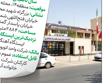
سالن تویی چندمنظوره: ۶۲۵ مترمربع (رشته‌های فوتبال، والیبال، بسکتبال و هندبال) اسکوی تماشاچیان سالن آبی: ۹۵ مترمربع (استخر، سونا و جکوزی) سالن بدنسازی: ۶۰ مترمربع سالن‌های ورزشی هوازی شامل ایروبیک، فیتنس و... پارکینگ: ۲۲۰ مترمربع