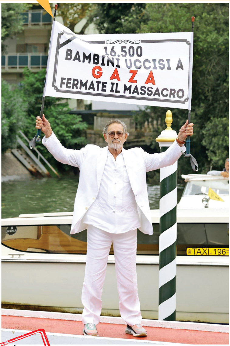
برندگان هشتمادوکمین جشنواره فیلم ونیز