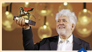
«پدرو آلمودوار» برنده شیر طلایی بهترین فیلم

بهترین فیلم بخش افق‌های ونیز «سال نویی که هیچ‌گاه نیامد» ساخته بوگدان مورسانو