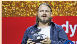
«بردی کوربت» برنده شیر نقره‌ای بهترین کارگردان