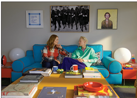
«اتاق کناری»: تکمیل فیلم قبلی آلمودوار

سینماگران با بیان اینکه هنر و سینما می‌تواند صدای کسانی باشد که در شرایط سخت زندگی می‌کنند، بر اهمیت همبستگی جهانی تأکید کردند. برخی از آن‌ها به تأثیر جنگ و خشونت بر زندگی روزمره مردم اشاره کردند و خواستار صلح و عدالت برای فلسطینیان شدند. جشنواره ونیز همچنین به عنوان یک فرصت برای یادآوری تاریخ و فرهنگ غنی فلسطین و تأکید بر نیاز به حفظ هویت فرهنگی این مردم مطرح شد. سینماگران با استفاده از این بستر، خواستار توجه بیشتر جامعه جهانی به وضعیت انسانی در غزه و حمایت از حقوق بشر شدند.