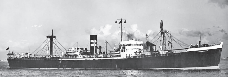
عکس قدیمی کشتی یونانی