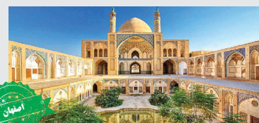
تنها مسجد لطیفه جهان

مسجد نصیر الملک شیراز به دلیل داشتن کاشی کاری های صورتی رنگ و شیشه های رنگارنگ به مسجد صورتی معروف و یکی از زیباترین مساجد کشور است.