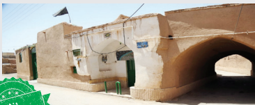
کوچک‌ترین مسجد ایران

مسجد «آرد و خرما» لقب کوچک‌ترین مسجد ایران را هم دارد. تاجری از شاهرود به‌علت مرگ شترش مدتی در اردکان ساکن می‌شود که یولی ندارد اما به جای دستمزد کارگران به آنان آرد و خرما می‌دهد تا این مسجد را بسازند.