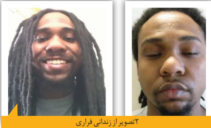
تصویر ارزندانی فراری

قاتل فراری از زندان که پلیس آمریکا برای دستگیری‌اش جایزه ۵۰ هزار دلاری تعیین کرده بود، به دام افتاد. به گزارش همشهری به نقل از آی‌بی‌سی، روز سه‌شنبه هفته گذشته یک قاتل محکوم به حبس ابد که در زندانی در کارولینای شمالی به سر می‌برد نقشه فرار از آنجا را کشید. او برای این کار تصمیم گرفت خودش را مسموم کند. برای همین با خوردن دارویی، خودش را به بیماری زد و به این ترتیب مسئولان زندان دستور انتقال او را به بیمارستان صادر کردند.