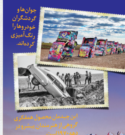
این چیدمان مخصوص هنرمندی گریزی از هنرمدان پیسرو در دهه ۱۹۷۰ است.

واندگانی که از بزرگراه ایالتی در نزدیکی شهر آمار بو در ایالت تگزاس عبور می کنند طبق یک سنت قدیمی، راهشان را کج می کنند تا از یکی از عجیب ترین جذابیت های دنیا بازدید کنند: مزرعه کادیلک. این مزرعه در واقع مجموعه ای از ۱۰ ماشین سواری کادیلک است که در دست ۵۰ سال پیش در یک تکه مزرعه تخت و خالی، همگی با زاویه ۶۰ درجه پشت سر هم در زمین کاشته شدند. این طرح ایده ای خلاقانه و نوآورانه از یک گروه هنرمند تجربه گرا بود که با حمایت مالی یک میلیونر ایجاد شد. از آن زمان، نیم قرن گذشته و این مزرعه که به نظر می رسد قرار بود کاری موقت