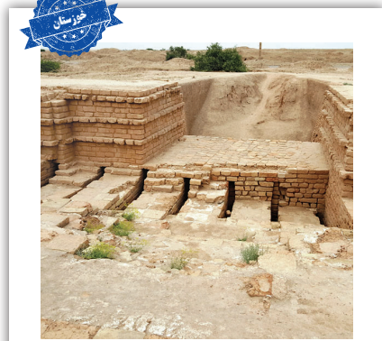
کهن‌ترین تفسیه‌خانه جهان

نام گیاهی که از آن برای توتن‌بافی استفاده می‌شود «توتک» است؛ توتن‌ها بیشترین زمان‌هایی مورد استفاده قرار می‌گرفتند که آب دریاچه هامون تا حد خیلی زیادی بالا می‌آمد و عبور از عرض دریاچه برای مردم سخت می‌شد.