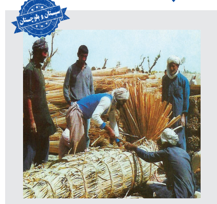
توتن، قایق سنتی

نام گیاهی که از آن برای توتن‌بافی استفاده می‌شود «توتک» است؛ توتن‌ها بیشترین زمان‌هایی مورد استفاده قرار می‌گرفتند که آب دریاچه هامون تا حد خیلی زیادی بالا می‌آمد و عبور از عرض دریاچه برای مردم سخت می‌شد.