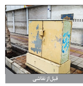
قبل از نقاشی