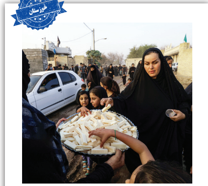
استقبال از زائران کربلا

حضور کودکان در حرم رضوی و بازیگوشی آنها، حس زندگی و یوایی موجود را دوچندان می‌کند. کودکان در حال دویدن و بازی کردن، در حالی که والدینشان در حال دعا و نیایش هستند، این تضاد بین بازی و عبادت، تصویری زیبا از زندگی را به نمایش می‌گذارد.