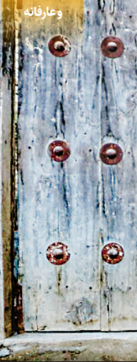
خانه فرهنگ استاد محمدرضا اسحاقی