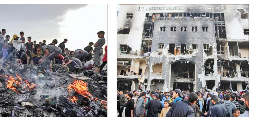
۵ بیمارستان الشفا

۱۸ نوامبر سال ۲۰۲۳ بود که اسرائیل با حمله به مدرسه الفاخوره که ذیل آرتو تحت حمایت سازمان ملل، آوارگان را در خود جای داده بود، باعث فاجعه‌ای انسانی شد و ۱۱۸ نفر شهید و ۷۶۰ نفر از مردم غیرنظامی زخمی شدند.