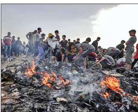
۶ جنایت رفح

در ژوئن امسال در مدرسه آوارگان در النصیرات، قسمت شمال شرقی غزه یکی از فجایع بزرگ تاریخ رخ داد. وقتی مردم در مدرسه مربوط به سازمان ملل حضور داشتند، بمب‌های اسرائیلی که ساخت آمریکا بود، بر سر آنها فرود آمد و ۴۰ نفر درجا شهید و ۷۴ نفر هم مجروح شدند.