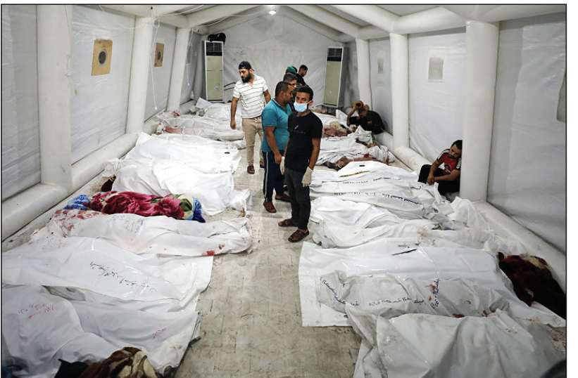
۱ قتل عام بیمارستان المحمدانی

در ۱۰ اکتبر هم جنایتی بزرگ در غزه رخ داد که جهان را مهلوت کرد. زمانی که مردم غزه در حال خواندن نماز صبح در محله الدراج غزه بودند، اسرائیل آنجا را بمباران کرد و هم به شدت مجروح شدند.