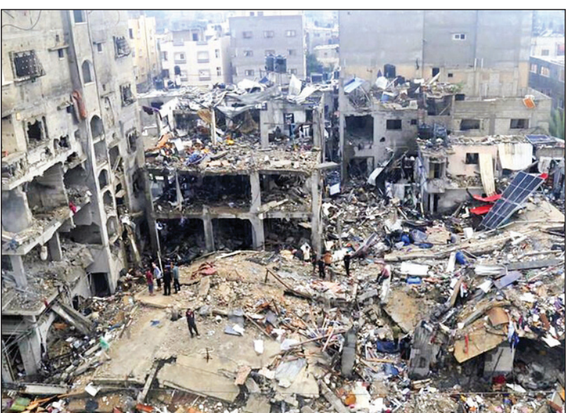
۳ مدرسه الفاخوره

رژیم صهیونیستی در ۱۷ اکتبر سال ۲۰۲۳ و درست ۱۰ روز بعد از عملیات ۱۷ اکتبر و طوفان الاقصی شروع به انتقام‌گیری از مردم عادی و غیرنظامی کرد. در بمباران هوایی اسرائیل ۵۰۰ نفر از مردم در این بیمارستان به شهادت رسیدند.