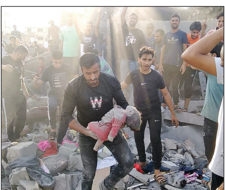
۷ جنایت اردوگاه النصیرات

۲۹ فوریه سال ۲۰۲۴ فاجعه‌ای در غزه رخ داد که بعدها معروف به روز خونین آرد یا نان یا خون شد. در حالی که مردم عادی منتظر بودند کامیون آرد وارد میدان نایلسی غزه شود، بمباران این منطقه توسط اسرائیل باعث به شهادت رسیدن ۱۲۰ فلسطینی شد.