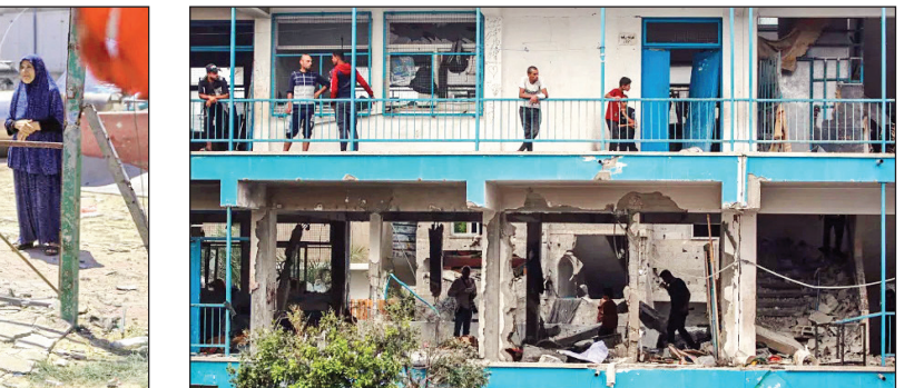
۸ قتل عام موصی خان یونس

۱۸ مارس سال ۲۰۲۴ یک جنایت ضدبشری بزرگ رخ داد که در تاریخ نسل‌کشی‌ها سابقه نداشت. در بمباران و بعد از حمله زمینی ارتش اسرائیل به بیمارستان الشفا در غزه نزدیک به ۴۰۰ نفر شهید شدند و بعدها بیکر ۱۴۰ نفر در گورهای دسته‌جمعی یافت شد.