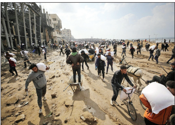
۴ روز خونین آرد

نیروی هوایی اسرائیل در حمله هوایی شدید به منطقه شمال شرقی غزه که جبالیا در آن قرار دارد، مناطق مسکونی را هدف قرار داد و در یک نسل‌کشی تمام‌عیار ۴۰۰ غیرنظامی اعم از کودک و زن شهید شدند.