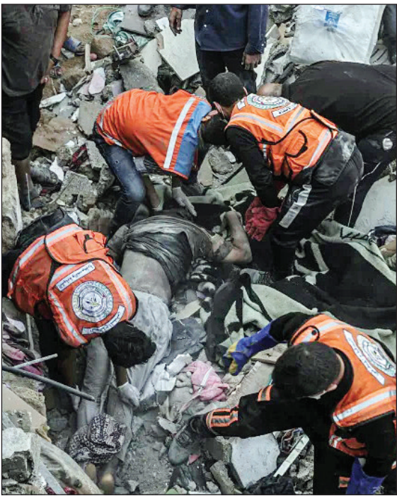
۲ کشتار جبالیا

حجم جنایت‌های رژیم صهیونیستی در غزه به قدری فاجعه‌بار است که برخی از محققان تاریخ آن را یکی از بزرگ‌ترین نسل‌کشی‌های تاریخ در بازه زمانی کوتاه می‌دانند. وزارت بهداشت غزه دو شنبه از افزایش شمار شهیدای تجاوزات رژیم صهیونیستی به این باریکه به ۳۹ هزار و ۸۹۷ تن خبر داد. در عین حال، رئیس کمیته بین‌المللی صلیب سرخ گفت: ما صدها درخواست در مورد غزه مطرح