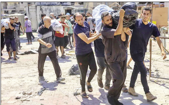
۹ مدرسه تابعین

مهم‌ترین نسل‌کشی بعدی اسرائیل در نوار غزه به ماجرای جادری که در تاریخ نسل‌کشی‌ها سابقه نداشت. در بمباران و بعد از حمله زمینی ارتش اسرائیل به بیمارستان الشفا در غزه نزدیک به ۴۰۰ نفر شهید شدند و بعدها بیکر ۱۴۰ نفر در گورهای دسته‌جمعی یافت شد.