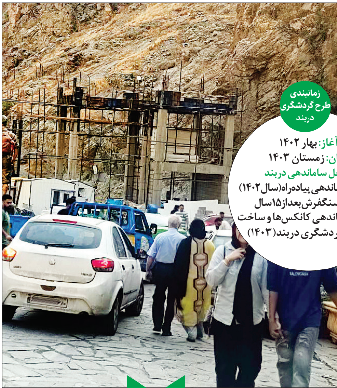
زمانبندی طرح گردشگری دربند

آغاز: بهار ۱۴۰۲ پایان: زمستان ۱۴۰۳ مراحل ساماندهی دربند فاز یک: ساماندهی پیاده‌راه (سال ۱۴۰۲) اجرای سنگفرش بعد از ۱۵ سال فاز دو: ساماندهی کانکس‌ها و ساخت دروازه گردشگری دربند (۱۴۰۳)