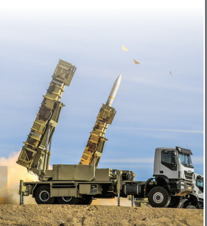
سامانه پدافندی تلاش