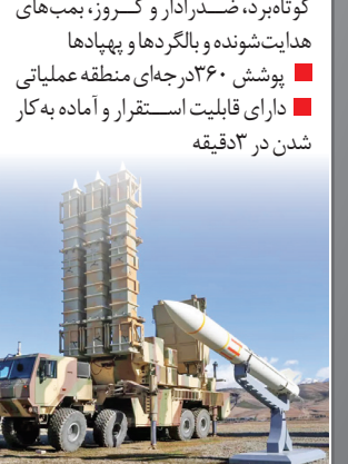
سامانه پدافندی تلاش

سامانه پدافندی تلاش نوع: سامانه پدافند هوایی برد متوسط و ارتفاع بلند سازنده: وزارت دفاع برد سامانه: حدود ۳۰۰ کیلومتر تسلیحات: موشک‌های صیاد ۳ ویژگی‌ها: داری قابلیت انهدام انواع بالگردها و هواپیمای بدون‌سرنشین برخوردار از قابلیت مقابله با تهدیدهای هوایی غافل‌گیرانه جنگنده‌های مدرن مشکل از ۳خودروی حامل لانچر موشک‌ها و ۲خودروی سامانه راداری کارآمدی در حوزه پدافند هوایی ارتقای توان رزمی پدافند هوایی