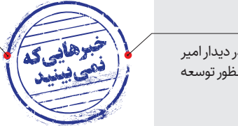
خبرهایی که نمی‌بینید