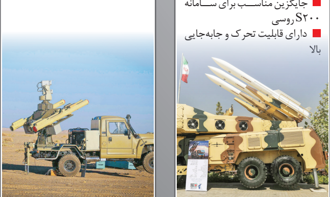
سامانه پدافندی مجید

سامانه پدافندی مجید نوع: سامانه پدافندی کوتاه‌برد سازنده: وزارت دفاع برد: ۱۸۰ کیلومتر ارتفاع درگیری: ۶ کیلومتر برد درگیری: ۸ کیلومتر موشک‌ها: AD-08 رادارها: کاشف ۰۹۹، آشیانه‌یاب ویژگی‌ها: داری قابلیت تحرک پذیری بالا با امکان استفاده از انواع حامل برخوردار از قابلیت استفاده از موشک بدون دود و اختفای بهتر داری قابلیت واکنش در ۳ ثانیه برخوردار از امکان درگیری همزمان با ۴هدف