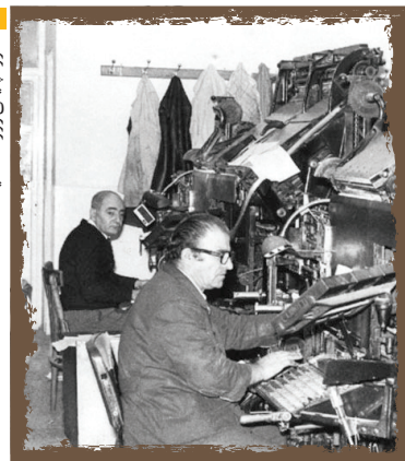
حرف‌نویسی روزنامه آلیک

نخستین روزنامه ارمنه در بدو حیات با مشکلات مالی مواجه بود اما از سال ۱۹۵۰ مورد حمایت گسترده جامعه ارمنه قرار گرفت و در تیراژ نسبتاً بالا چاپ شد. این روزنامه که به زبان ارمنی منتشر می‌شود، در مقاطع مختلف تاریخی با اکثریت مردم همراه بوده و در آستانه پیروزی انقلاب اسلامی هم به اعتصاب