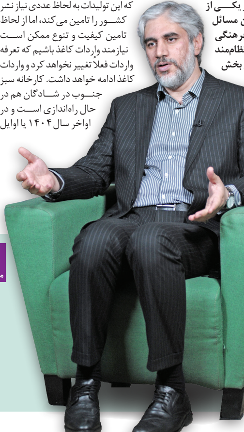
یاسر احمدوند، معاون امور فرهنگی وزارت فرهنگ و ارشاد اسلامی

نظارت بر کتاب‌های منتشره در کشور یکی از حساسیت‌برانگیزترین مسائل در معاونت امور فرهنگی محسوب می‌شود، برای نظام‌مند کردن قاعده کار در این بخش چه کردید؟ در این بخش، راه‌اندازی هیأت نظارت بر