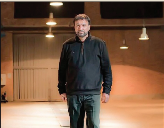
حسین دارابی، کارگردان فیلم «خدای جنگ»