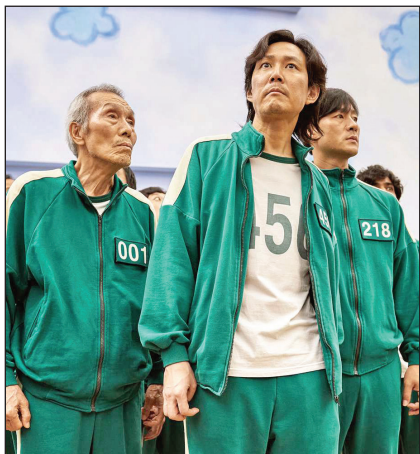
صحنه از فصل اول سریال بازی مرگ

بازی مرگبار با ترکیبی از هیجان و خشونت، هم سرگرمی می‌سازد و قصه می‌گوید و هم با ارائه تصویری انتقادی از سلطه سرمایه‌داری نوین بر زندگی و زمانه معاصر، همدات‌پنداری انبوه آدم‌های گرفتار و در تمنای ثروت در هر گوشه جهان را جلب می‌کند.