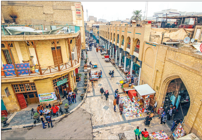
تصویر اصلی بازارهایی که در سرزمین تمدن‌ها بازسازی شده‌اند

حدود ۹ قرن از عمر خیابان متنی می‌گذرد. این خیابان اگرچه طولی کمتر از یک کیلومتر دارد، اما به دلیل داشتن چاپخانه‌ها و کتابفروشی‌های بسیار به قلب تپنده عراق و قله آمال فرهیختگان و علاقه‌مندان به فرهنگ در این کشور معروف است. متنی همچنین پاتوق اهالی هنر نیز محسوب شده و در آن برنامه‌های هنری بسیاری از جمله اجرای موسیقی برگزار می‌شود. همه این ویژگی‌ها دست به دست هم داده تا بازارچه عراق در نمایشگاه سرزمین تمدن‌ها جایگاه ویژه‌ای داشته باشد. بازارچه‌ای که از سنگ و آجر ساخته شده است و قبل از دروازه بابل قرار دارد.