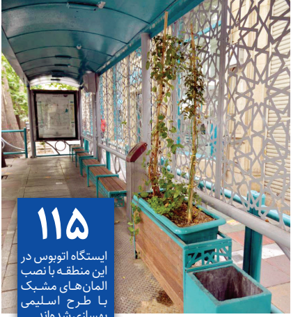
ایستگاه اتوبوس در این منطقه با نصب المان‌های مشبک با طرح اسلامی بهسازی شده‌اند.

چند روزی است مسافران خطوط تندروی خیابان ولی عصر (عج) در بعضی از ایستگاه‌ها، حال و هوای متفاوتی پیدا می‌کنند و روحشان تازه می‌شود چرا که ایستگاه‌های اتوبوس منطقه یک با هدف ترغیب شهروندان به استفاده از وسایل حمل‌ونقل عمومی با نصب المان و مبلمان جدید و با کاشت گیاهان پوششی زیباسازی و سبز شدند.