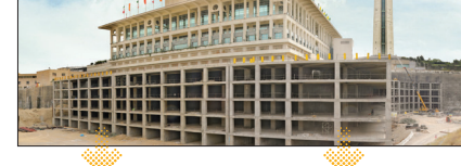
تیرماه ۱۴۰۲ عملیات اجرایی پایدارسازی گود جانبی مرکز همایش‌های برج میلاد شروع شد. آبان ۱۴۰۲ مرحله اول عملیات پایدارسازی به پایان رسید.